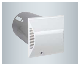
Runde Wandhülle mit Außenwandblende