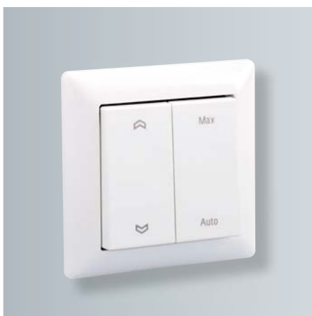
Formschöner Funk-Bedienschalter (nur in Verbindung mit Vitovent 200-D, Typ HRM A55)