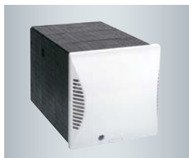
Quadratische Wandhülle mit Außenwandblende

Das kompakte Wohnungslüftungsgerät Vitovent 200-D ist für die kontrollierte Be- und Entlüftung einzelner Räume ausgelegt. Die einströmende Luft wird gefiltert und über den eingebauten Kreuz-Gegenstrom-Wärmetauscher mit der Wärme aus der entzogenen Raumluft erwärmt. Der Wärmerückgewinnungsgrad aus der Abluft beträgt bis zu 90 Prozent. Pro Stunde werden bis zu 55 m 3 Luft ausgetauscht. Beim Einsatz mehrerer Geräte lassen sich vollständige Lüftungskonzepte realisieren.